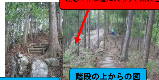
階段の上からの図