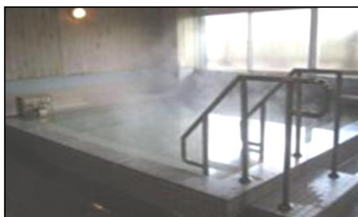
大浴場(一度に30名程度の浴場が4つ)