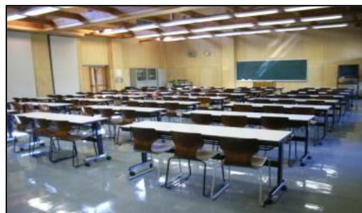
レクや運動でも利用可能な大研修室