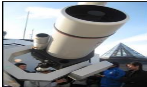
天文台(400mm反射望遠鏡)