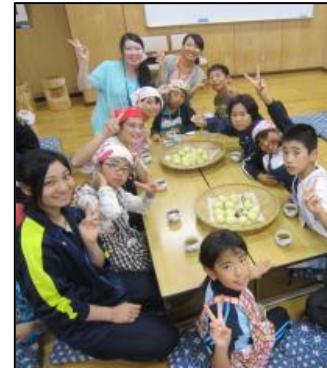
手作りまんじゅう体験 (多様な体験活動が充実)