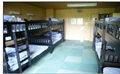
寝室(2段ベッドや畳の大広間)