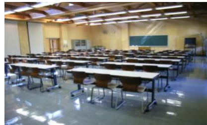
大研修室(100席×2室)小研修室(50席×2室)